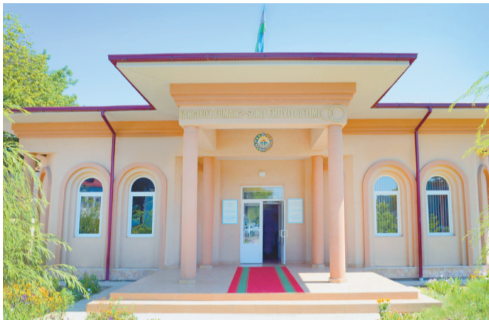
СУРАТДА: 2-фуқаролик ҳолати далолатномаларини ёзиш бўлими.

– Қишлоқларимизнинг шаҳар билан бўйлашаётгани, одамларимиз ҳаёти, умуман, барча соҳада юз бераётган ўзгариш ва янгиликлар тинчлик ва осойишталик, мустақиллик туфайлидир, – дейди Янгийўл тумани ҳокимининг биринчи ўринбасари Равшан Норбўтаев. – Ана шу улғунёматларнинг қадрига етиш, кўз қорачиғидек асраш ҳар биримизнинг фуқаролик бурчимиздир.