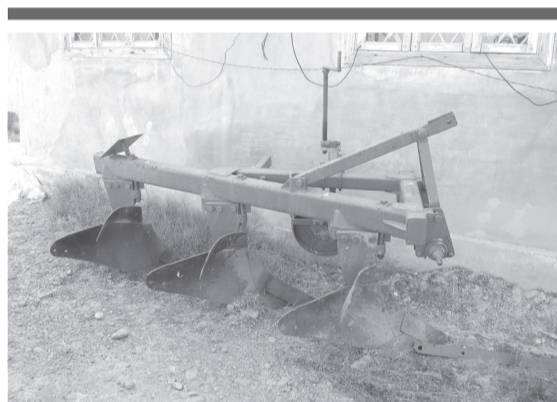
ПЛНЗ – 35 п русумли янги плуглар (Россияда ишлаб чиқарилган)