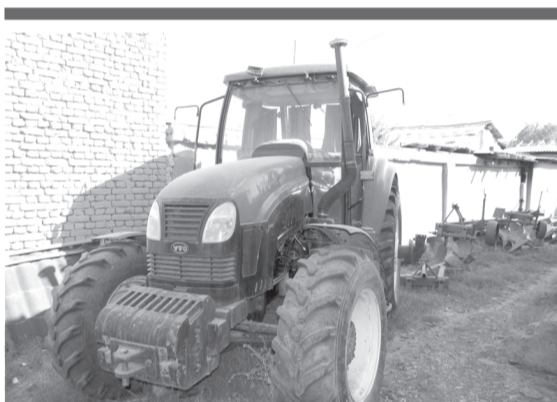
Баллонли ЮТО-1254 трактори, 2008 йилда ишлаб чиқарилган (Хитой)