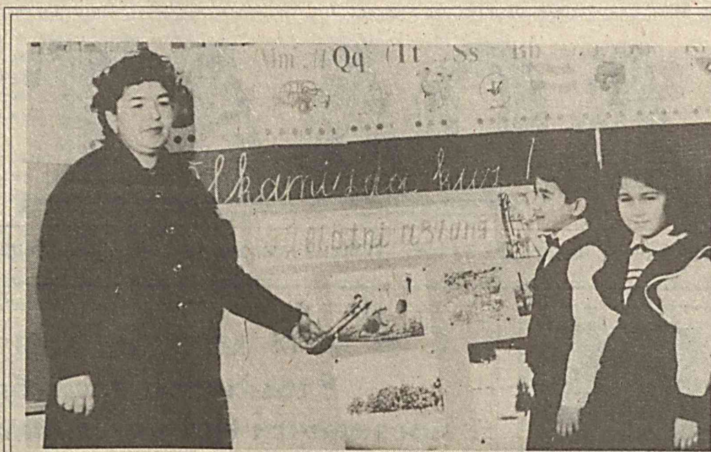
Ёшларга пухта билим бериб, уларни Ватанимизнинг муносиб фарзандлари этиб тарбиялаш ҳар бир илм даргоҳи олдига турган муқаддас вазифадандир.

жойини қазиб қуришса, у ердан бир хум олтин чиқибди. — Маана шу эди уни қутқаришган.