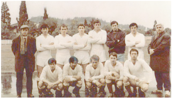
СУРАТДА: хотирада қолган футбол юлдузлари.

Турнирда ҳудудий босқичлар қолиб бўлган кучли олти жамоа голиблик учун майдонга чиқди. Голиб жамоаларга таълим ва фан ходимлари касоба уюшмаси туман бирлашган кўмитаси, Ўзбекистон ХДП туман кенгаши, савдо ходимлари ва тадбиркорлар касоба уюшмаси туман вакилликнинг эсдалик совгалари топширилди. Латифжон МАНСУРОВ.