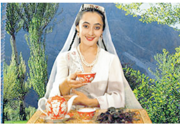
(Давоми. Бош 1-бетда).

Шунда ўғил: "Ота, келинг, ким яхши яшайди бора-сида баҳс боғлайлик.