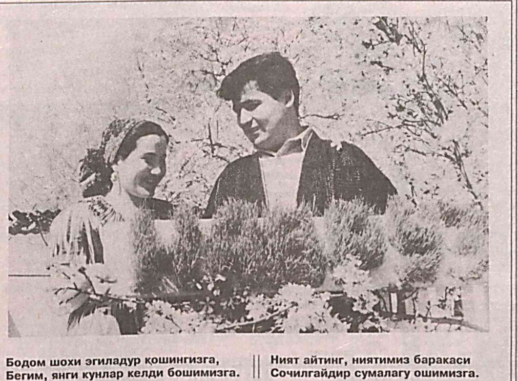
Бодом хоши эгилладур қошингизга, Бегим, янги кулар келди бошимизга. Ният айтнинг, ниятимиз баракаси Сочилгайдир сумалуга ошимизга.