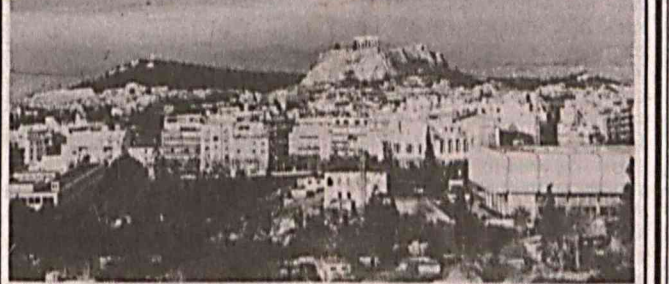
СУРАТДА: Греция манзаралари.

Борис Ельцин 1962 йилда туғилган Сергей Кириенко Россия ҳукумати Раисининг биринчи ўринбосари этиб тайинлаш тўғрисида Фармон қабул қилди. Сергей Кириенко ўш бўлишига қарамай утган йилнинг ноябрь ойида Россия Федерацияси ёқилги ва энергетика вазирлиги этиб тайинланган эди.