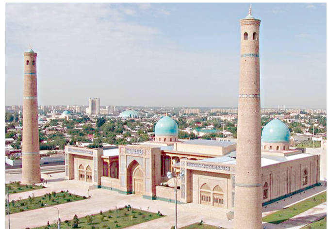
(Давоми. Боши 1-бетда).

Тошкент шаҳар Чилонзор тумани ТСРҲИ томонидан рўйхатга олинган "ELCHI AVTOSERVICE" (ИНН 301176279) МЧЖ Чилонзор тумани ТСРҲИ томонидан рўйхатга олинган "NAFISA GRAND" (ИНН 302618124) МЧЖ таркибига тўлиқ бириштирилиши ҳамда "NAFISA GRAND" МЧЖ "ELCHI AVTOSERVICE" МЧЖнинг барча ҳуқуқ ва мажбуриятларини ўз зиммасига олган ҳолда унинг тўлиқ ҳуқуқий ворисига айланишини маълум қилади.