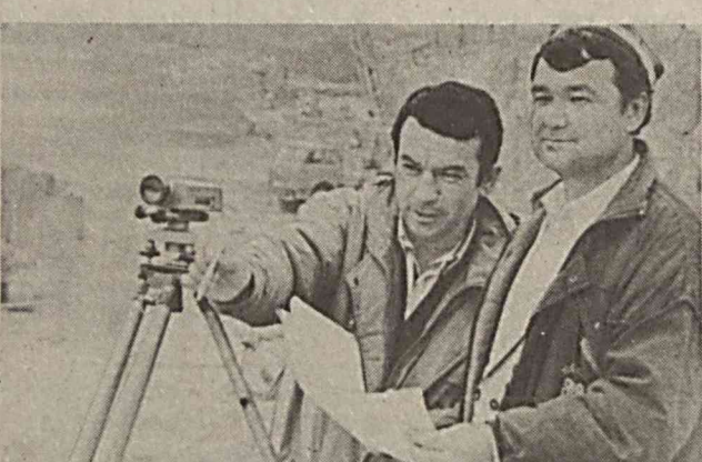
СУРАТЛАРДА: қурилиш майдонларида юбилейга тайёргарлик аажиди.