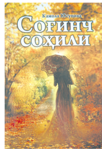
Узилади охириги шуъланг. Тонг сахарда порлаб қолсан, Жилваланар нурунги ранг-баранг.

Кўз узмасдан ботишинг қутиб, Юракларинг тўла сафоси. Ахир ўтган кунни унутиб, Яна қайтар кун ибтидоси. Узқолларга чорлаб қолсан,