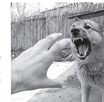
Улоқтириб юборади. Беморнинг кўзлари қақчайиб кетади, сувдан қўрқадиган бўлиб қолади, нафас олиши қийинлашади. Сал шамол эсса ҳам

Ит тишлаган пайтдан то кутуришнинг белгилари пайдо бўлгунча қадар касалликнинг яширин даври ҳисобланиб, буни одамда ҳеч қандай аломатлар кўринмайди. Касалликнинг бошланғич