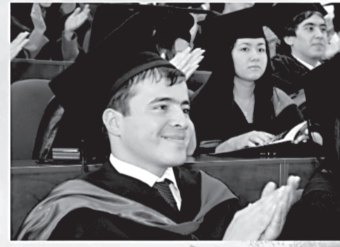
Келажак учун ЖАМГАРМА ЭШИКЛАРИНИ ОЧИНГ!

• Янги уйлар Сиз учун узоқ муддатли сармоя ва фарзандлар учун мерос.