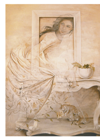
Нега ҳеч ким кўринмапти? – уйга кираётиб сўради қайинингли.

– Худого шуқр ҳаммамиз яхшимиз, қани уйга кириг.