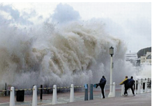
Кучли тўфон ўтган душанба кунини Япониянинг

"Манья" тўфони Япония соҳилларига етиб келгани боис мамлакатнинг 20 та префектурасида 500 мингга яқин хонадонга кўчиш ҳақида тавсия ёки мажбурий кўрсатма берилганини маълум қилди NHK агентлиги.