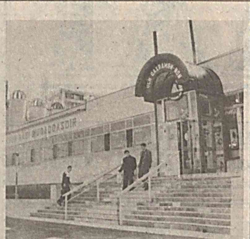
лаётган яна бир янгиликдан бениҳоя тўқинландик. Туман худудида ишга туширилган янги ривожлантириб бутун маҳсулотни 100 фоиз шундай усул билан ишлаб чиқаришни ишчан жамоа ўзининг катта муддаосига айлантирган.

Тошкент чинакамига нон шахрига айланди, — дейди Тошкент нон ишлаб чиқариш уюшмасининг раиси Абдували Нурматов биз билан сўхбатда. — Айти пайтада 53 та корхона шахарлик истеъмолчиларга, унинг меҳмонларига ўзининг шу кунининг талабидидаги нон, макарон, қандолат маҳсулотларини узлуксиз етказиб берапти. Шуларнинг 39 тасида Олмониянинг «Винклер» ҳизматлари ўрнатилган. Демак, пойтахт аҳолиси эҳтижи учун кунига 430 тонна нон ва нон маҳсулотлари ишлаб чиқарилаётган бўлса шунинг катта қисми мазкур замонавий анжумларнинг ҳиссасига тўғри келяпти.