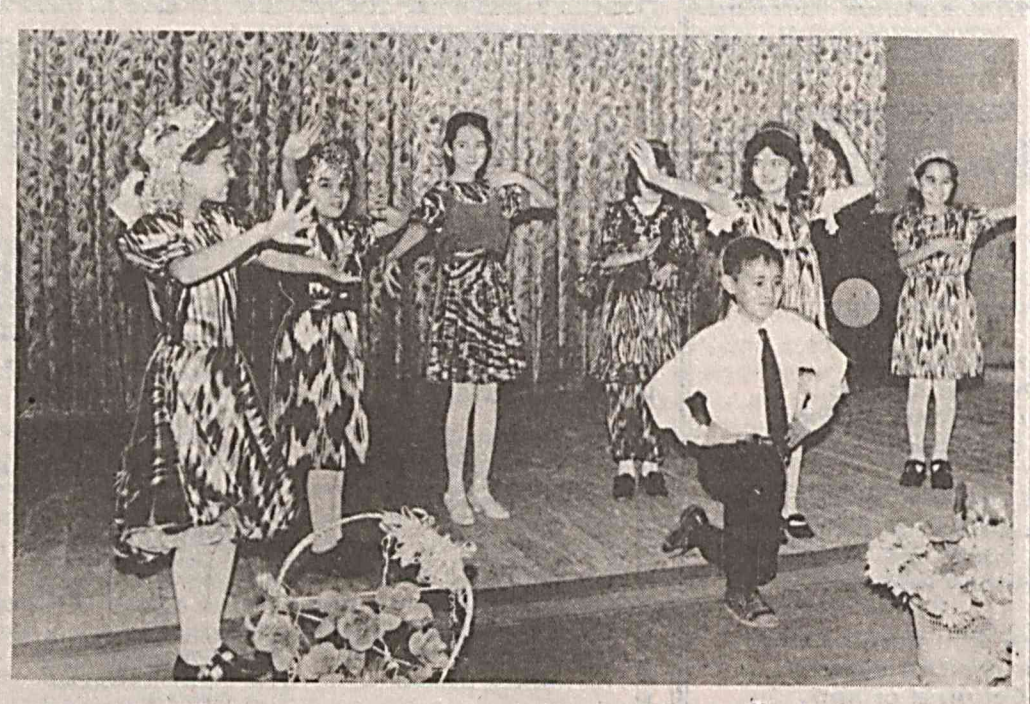
Кўриб қўйинг — сахнада — Ўзбекистон ёшлари! Ният қилинг, илоҳ, Омон бўлсин бошлари! Улар дер: «Ўзбекистон — Гулзоридан — гулбандимиз. Юртбошимиз айтгандек, Бизлар унга дилбандимиз!!»