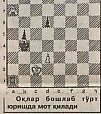
Оқлар бошлаб тўрт юришда мот қилади