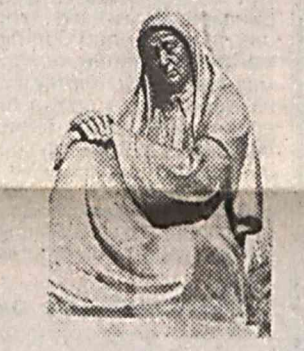
отаси оддий деҳқон бўлган. Деҳқончиликдан обуру-эйтибор топиб эл озгига тўшган. Урушга кетишдан олдин Каттақурғон шахрида электр тармоқлари қорхонасида машинист бўлиб ишлаган. Ана шу қорхонада халол хизмат қилиб, жамоа ҳурматино қозонган.

Начора! Йигидан қаро бўлмас кўз, Ундан бошқага бермади ғамни. Сўнги нафасда ҳам, ё раб, сўнги сўз: «...Уруш қайтармади Фани тоғанни!!!»