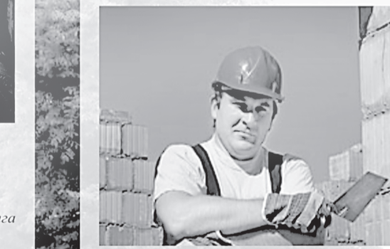
Марҳамат, мурожаат қилинг: