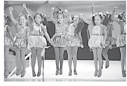
ган гала-концерт эса ноябрь ойи охирида Тошкент шаҳрида ўтказилади. "Туркистон-пресс".

жами 35 835 нафар болалар иштирок этиб, ўз қобилиятини синаб кўриш истагини билдиришди. Туман ва шаҳарларда ўтказиладиган саралаш турларига томошабинлар эркин киришлари мумкин ва бу иштирокчиларнинг яқинлари ҳамда томошабинлар учун фестивалнинг саралаш жараёнини кузатишга имкон беради. Танлов шартларига кўра, барча чиқишлар жами тарзда ижро этилади, фотоматериалдан фойдаланишга йўл қўйилмайди. Фестивалнинг финал бошқичи ва голибларни тақдирлашга бағишлан-