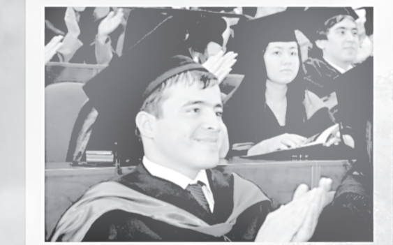
Келажак учун ЖАМГАРМА ЭШИКЛАРИНИ ОЧИНГ!

Янги уйлар Сиз учун узоқ муддатли сармов ва фарзандлар учун мерос.