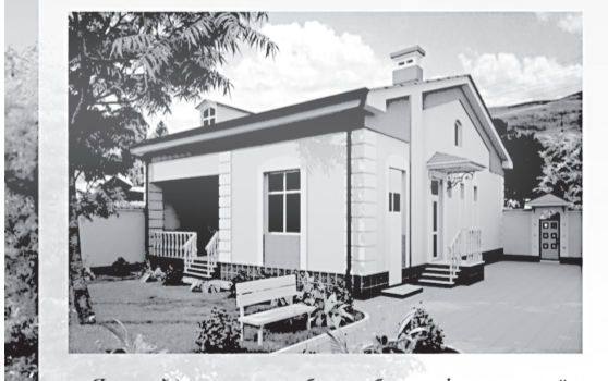
Келажак учун ЖАМГАРМА ЭШИКЛАРИНИ ОЧИНГ!