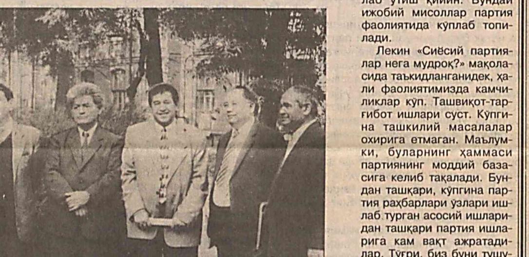
СУРАТДА: «Адолат» СДП фаолларидан бир гуруҳи.

Дарҳақиқат, Узбекистоннинг сиёсий харитасига назар ташласак, утан қарийб саккиз йил мобайнида бешта партия вужудга келди. Битта «Халқ бирлиги» ҳаракати фаолият кўрсатаётганда. Гарчи улар бирин-кетин пайдо бўлган бўлсалар-да, нима учун уз фаолиятларини жонлантира олмадилар? Халқнинг хоҳиши-иродасини унинг барча қатламлари сиёсий онгини, сиёсий фаолиятини ифодаловчи, бир-биридан номлари гузал бўлган масқур кўнглили бирлашмалар нима учун халқнинг ичига чуқурроқ кириб боролмадилар. Маана шу саволларнинг айнан сайловлар арафасида қўндалан бўлаётганлиги табиийдир.