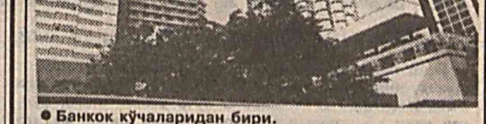
Банкок кўчаларидан бири.

БМТ Бош қотиби Кофи Аннан яқин вақт ичида Косово масалалари бўйича уларнинг махсус вакилини тайинлашни маълум қилди.