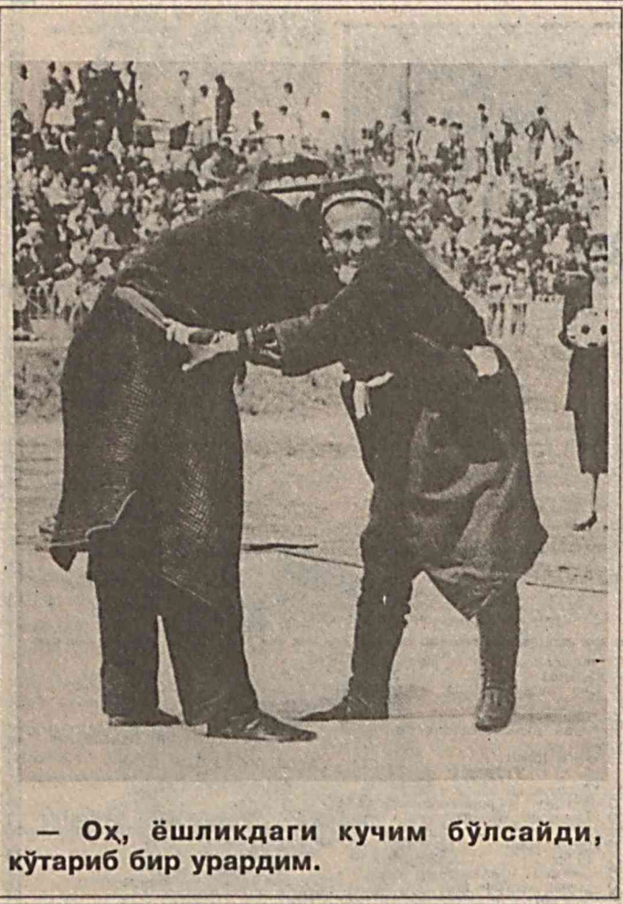
— Ох, ёшликдаги кучим бўлсайди, кўтариб бир урардим.