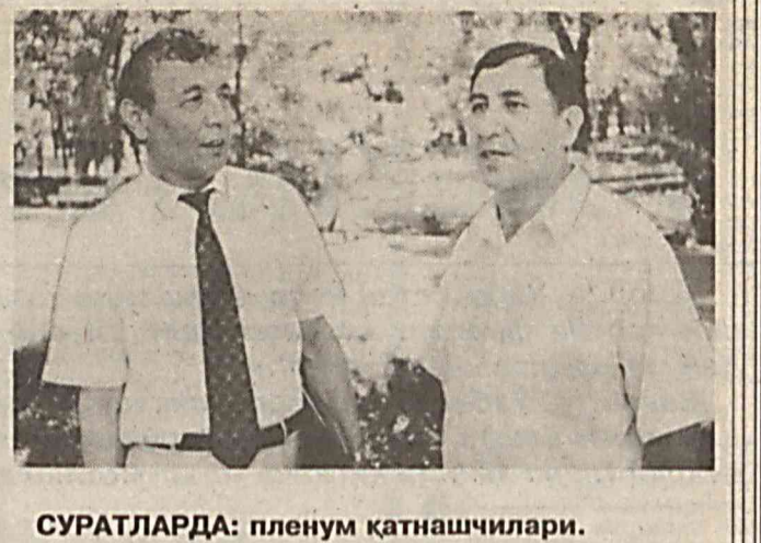
СУРАТЛАРДА: пленум қатнашчилари.