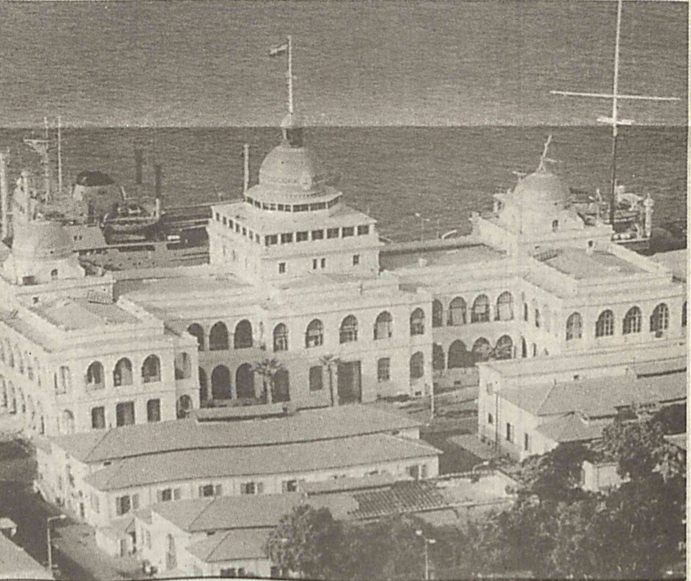
БУГУНГИ МИСР. Сувайш канали қирғоғи.

Очигини айтиш керакки, Билл Клинтоннинг қобилиятли инсон эканлигини ҳеч ким инкор этмапти. Уларнинг фикрича, собиқ президент одамлар ва жамоатчилик билан мулоқотда яхши таассурот қолдира олиши, конгрессда ўз нуқтаи назарини ўткази олиши, энг асосийси ўзига қарши уюштирилган вазиятларда «судан қуруқ чиқа олиш» қобилияти ноёбдир. Шу билан бирга Билл Клинтон ҳақида салбий фикрлар ҳам кўпайиб қолди. Масалан, доимо унга дўстона муносабатда бўлиб келган «Вашингтон пост» газетасида чоп этилган «Клинтоннинг президенти» сарлавхали тахририят мақоласида қайд этилишича, «Клинтон доимо тугма қобилиятли сийбасчи бўлиб келган ва бундан кейин ҳам шундай бўлиб қолади. У ўзидаги фазилатни америкаликлар ҳаётини тубдан яхшилашга сарфламади...» Унинг тарафдорлари шундай фикрларни айтганда мухолифларига гап йўқ. «Вашингтон пост» газетасининг ёзишича, Клинтон Бушга «ожишлик меросини» қолдирапти. Чунки дунё ҳамжамияти энди АҚШнинг ҳарбий кучидан қўрқмай қолди. Бу энди, профессионал сийбасчиларнинг фикрлари. Аммо америкалик кўплай