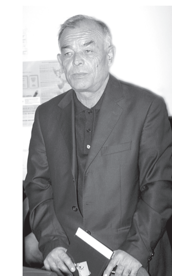
овоз олган амалдаги оқсоқоқ қишлоқ фуқаролар йиғини раислигига қайта сайланди. Шунингдек, 18 номзоддан 9 нафари раис маслаҳатчилари этиб сайланди.