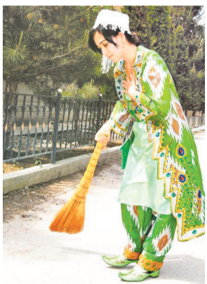
Ўтмаёқ, ивирисиб, тўзиб ётган ҳовли ораста бўлди. Йўлкаларга жой ажратилди, қолган қисми яхшилаб чопилди. Текислаиб, рўзгор учун зарур қўқатлар сепилди. Ҳатто, қора мурчача экилди. Дарвозадан