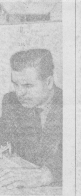
«Чирчиксельман» заводи рационализатор ва ихтирочилари Москвалик ҳамда Ленинградлик сановатчилар ташаббусига қўшилди.