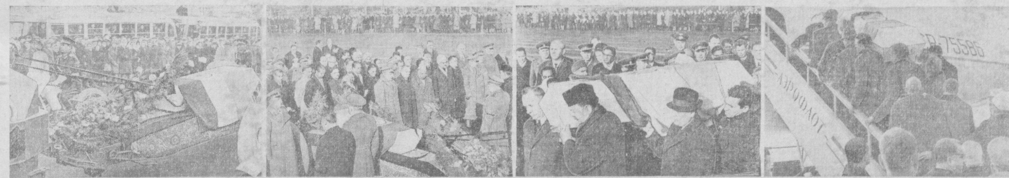
Кеча бутун Тошкент ҳинд халқининг улғу фарзанди, атоқли давлат арбоби, Совет Иттифоқининг яқин дўсти Лаъл Баҳодир Шастри билан яқинлашди. Биринчи суратда марҳумнинг жасади солинган тобут тўп лафетидан Тошкент аэропорти томон олиб борилмоқда. Иккинчи суратда Тошкент аэропорти, марҳумнинг тобутни ёнида. Учинчи ва тўртинчи суратларда А. Н. Косигин, Мухаммад Аюбхон, Р. Қурбонов ва бошқалар тобутни кўтариб саноқетида чиққондилар.