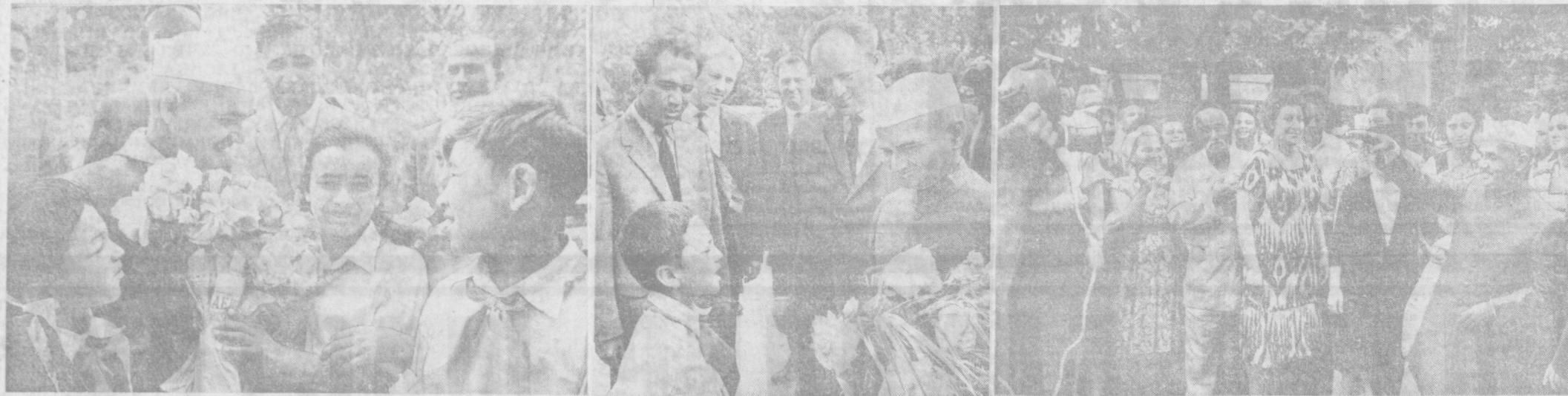
Лаъл Баходир Шастри совет халқининг яқин дўсти эди. У бир неча бор Совет Иттифоқига келиб, халқларимиз ўртасидаги дўстликни мустаҳкамлаш ишига катта ҳисса қўшди. Жумладан у Ўзбекистон меҳнатқилларининг ҳам азият меҳмони бўлган Сиз билан ерда Лаъл Баходир Шастрининг 1985 йил май ойида Тошкентда бўлган пайта олинган суратларни кўрипсиз. Суратларда (Ўнган): Лаъл Баходир Шастрининг тошкентликлар билан учрашуви ҳамда Тошкент область «Қизил Ўзбекистон» колхозининг махтаб-интернат пионерлари билан суҳбати тасвирланган.