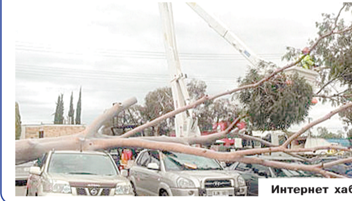
Интернет хабарлари асосида тайёрланди.

Испанияда Галициянинг шимоли-ғарбида кучли шомол хурж қилмоқда. Темир йўл устига қулаган дарахт электр поездларидан бирининг издан чиқиб кетишига сабаб бўлди.