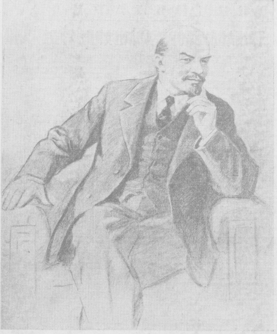
Владимир Ильич ЛЕНИН