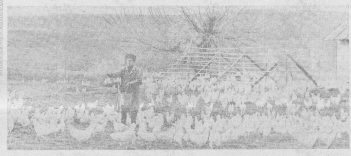
Ормонинида райониди Кирова номли колхоз парандачилари...

Т. ЯҒДУШЕВ. Ҳўта Чирчиқдаги Оқубобоев номли колхоз.