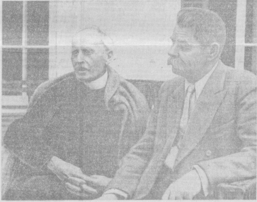
Ромен Роллан ва Максим Горький.

медов эвеносиз 1964 йилда ҳар гектар ердан 31 центнердан пахта етиштирди. Демак эвено аъзо-ларининг олдилар билан ҳамкор-лиги яқин натижаларга олиб кел-ган, яъни ҳисдорлик гектар бор-шига 2 баравардан энг қўнлайди. Юқорида келтирилган мисол-лар шунинг кўрсатадики, ўзбекистон олдилари асосий бойлигиниз, мил-лий иштихоримиз бўлган пахта етиштириши қўнлайтириш учун олиб борилаётган умумхалқ кура-шида актив иштирок этмоқдалар ва совет пахтачилигини ривожлан-тиришга ўзларининг улкан ҳисса-ларини қўшмоқдалар. Демак, фан коммунизм моддий-техника база-сини вуқудга келтирувчи ишти-моий-иқтисодий факторлар ораси-да муҳим ўрнини эгаллар эвено. Коммунизм қурилиши жарайди-да совет фанининг ютуқлари фа-қат коммунизмининг моддий-техника базасини вуқудга келтиришда кенг қўнлашиш билан чегараланиб қўнлайди. У биланорлар коммунизм кўнлайтириш асосий вакиллари бўлган— коммунист иштимоий муносабатларини шакллантириш ва янгий инсонни тарбиялашда ҳам муҳим роль ўйнайди. Партиянинг Программасида кўрсатиб ўтилаг-ди, «Фан-техника тараққийети жуда аяқ олган бизнинг асримиз-да фан ютуқларидан планли су-ратда ва ҳар томонлама фойдал-ланмасдан туриб жамиятни ва ин-сон шахсини ривожлантириб бў-лмайди». Демак, коммунизм кури-лиши фан ютуқларини жамият ҳаётида ҳар томонлама ва тўлиқ қўнлайди асосланади. Коммунизм қурилишида фан ишлари бонинҳа катта бўлган-лиги учун Коммунист партия ва