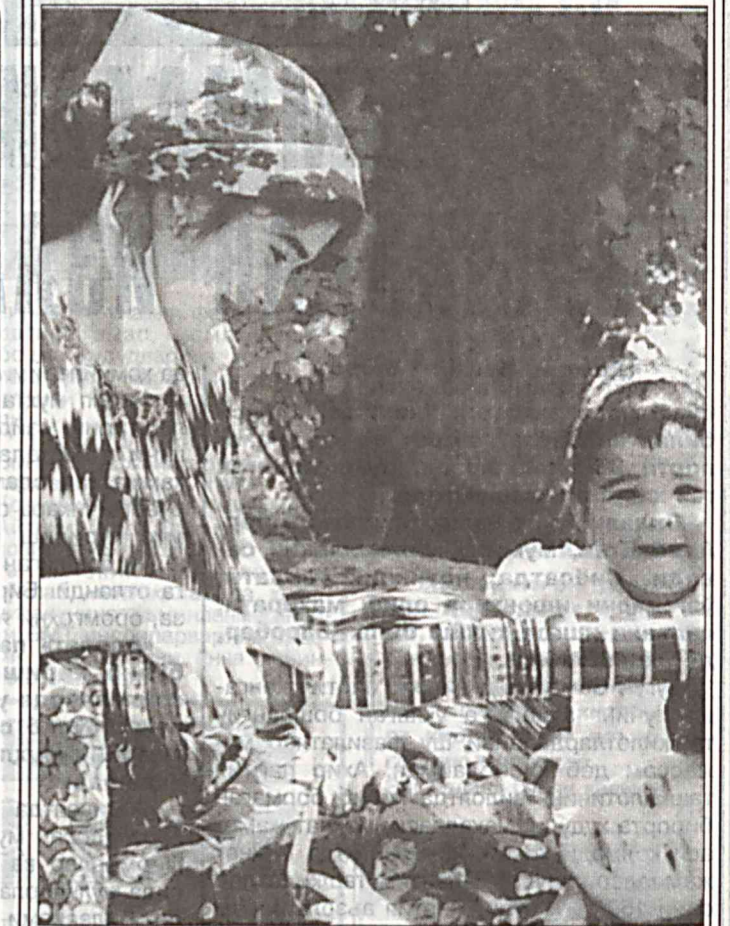
Мунис она бешик узра мудом парвона, Бешикдан масрур улғаяр бола—дурдона.

Тиши оғрийтган бемор қалтираганча тиш дўхтирининг хонасига кириб келди.