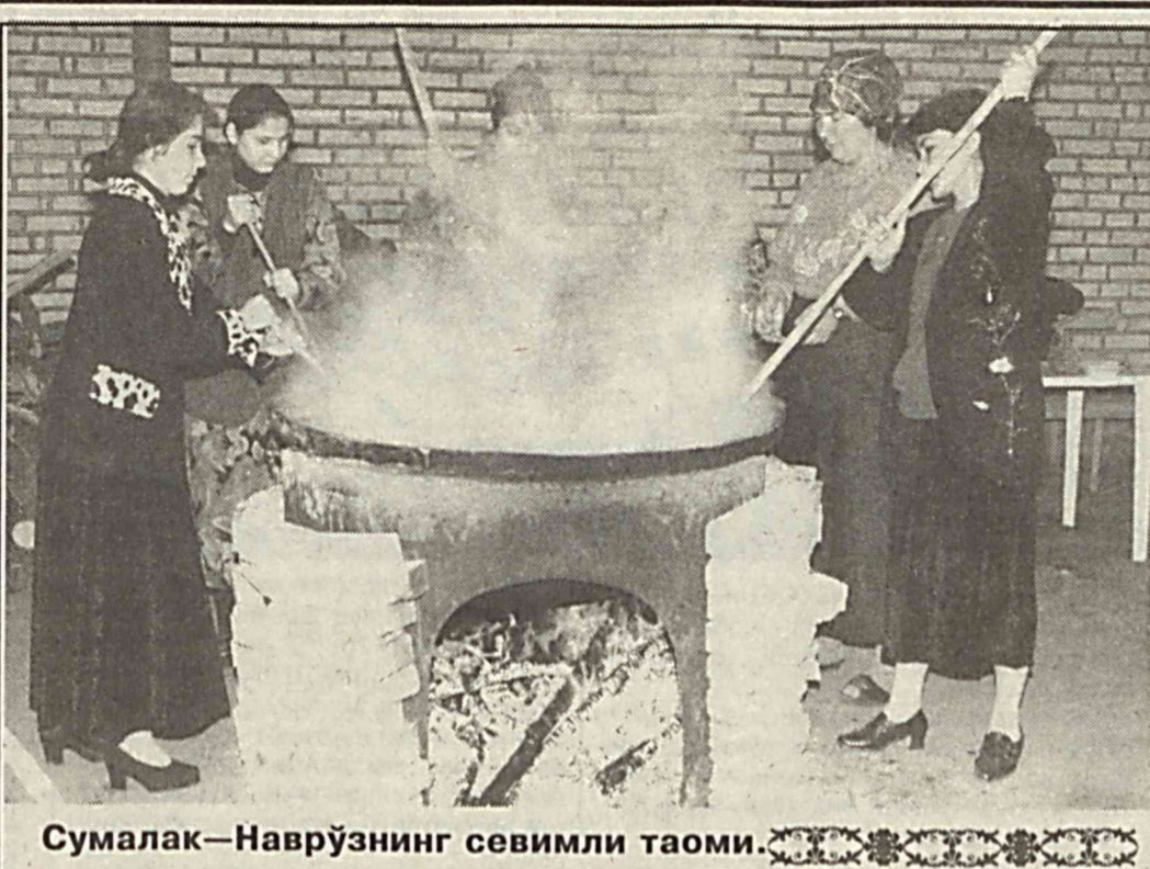
Сумалак—Наврўзининг сеvimли таоми.

«Қўтағду билигдан оқка қўчирувчи О. БЕКОВ.