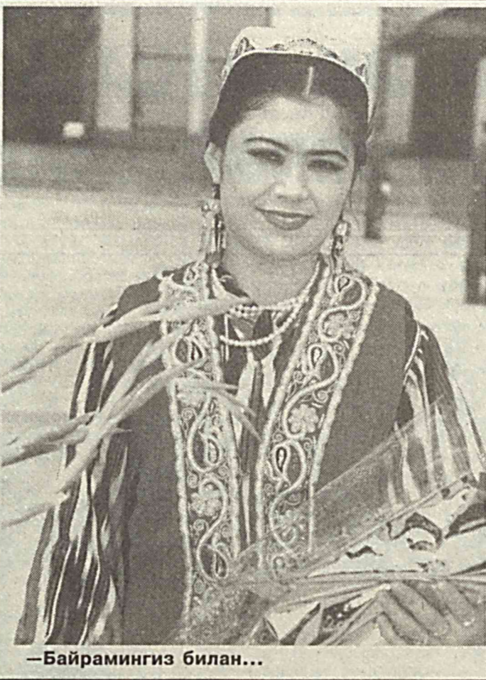
— Байрамингиз билан...

• Узок қузатишлардан сўнг шу хўлосага келиндикми, чўмилиётган одамнинг бой ёки камбағаллигини биллиб бўлмаскан. • Таърихлардан шундай хўлоса ясалдик, ақл билан олинган пора қўл билан олингандан анча қулай ва хавф эҳтимомли кам экан. • Социологик тадқиқотлар шуни кўрсатдики, бугунги иш эртага қолса, эртанги иш ўз-ўзидан индинга қолар экан. • Бозорда ўтказилган сўровдан шу нарсა маълум бўлдики, иш шу йўсинда боровар экан, келажақда одамларнинг турли ҳилдаги қўғоз ва ҳўжатларга эмас, нақд пулга ишончларига орта бороваркан. • Лаборатория қузатишлардан шундай хўлосага келиндикми, бир-биридан қарз олган кишилар бир-бирлариникига меҳмонга боришмас экан. • Яқинда олимларимиз тўзини шаҳарга айлантириш йўлини кашф этдилар. Хўлоса шуки, туз овқатга солинганда шаҳарга айланар экан. • Авълларни ошончага кўпроқ жалб етиш муаммоси ҳал этилди. Бунинг учун телефон апаратыни тўғридан-тўғри ошончага ўрнатилса, кифоя экан. Илҳом ЗОЙИР.