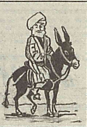
масанг бўлгани, — деб жавоб берибди Афанди.

— Вей, менга қара, — деди у. — Бас қил йиғинг. Яхшиси янги қийилларингни кийиб, пардоз-андоз қил. — Вой, Афандим-эй, — дебди хотини ажабланиб, — сиз бу аҳволда етибисизку... — Агар мени яхши кўрсанг, тезда ясаниб ол, — дея у ўз сўзига қаттиқ турибди. — Бўл, тезроқ айтганимни қил. Афандига хос қизиқувчанлик ўстун келиб, хотини сўрабди: — Майли, айтганингизни қиламан, лекин аввал нима учунлигини айтиб берасиз. — Айтардим-у, лекин хафа бўласан-да. — Худо ҳақки, хафа бўлмайман, тўриси айтинг, — дебди хотини. — Биласанми, хотинжон, — дебди Афанди жиддий, — менинжонимни олишга келган Азроил, ясан-тусан ва пардоз қилганингни кўриб, қўниги кетиб, зорамнинг ўримига сеникини олса. — Бу сўзини эшитган хотин ханг-манг бўлиб қолибди.