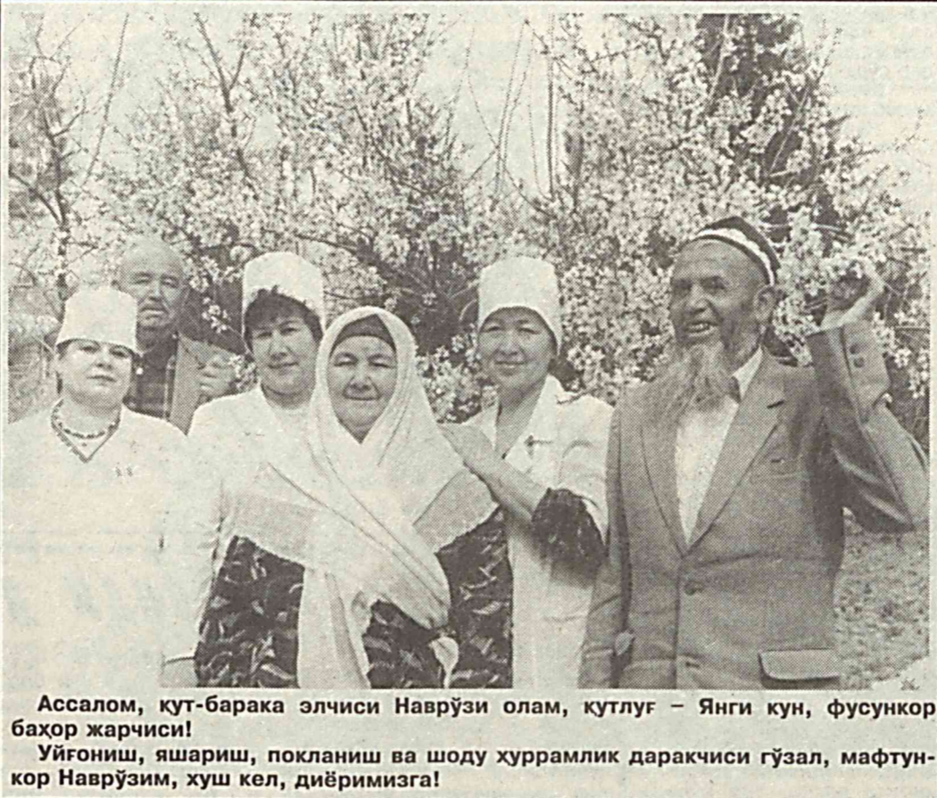
Ассалом, кут-барақа элчиси Наврўзи олам, кутлуг — Янги кун, фусункор баҳор жарчиси! Уйғониш, яшариш, поклиниш ва шоду хуррамлик дарақчиси гўзал, мафтункор Наврўзим, хуш кел, дийримизга!