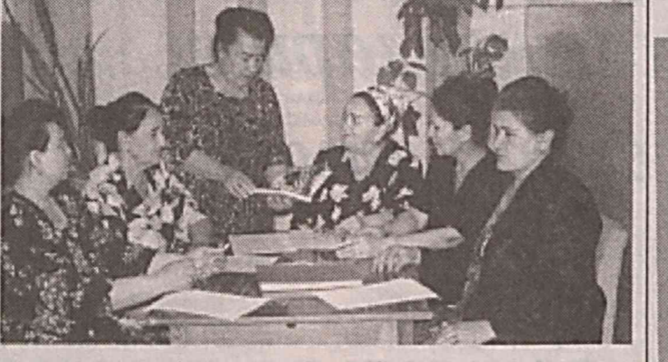
Қадамлар қўлида олиш шарафидан.

Шу йил 21 март кuni ФИФА президенти Зепп Блаттер Руанда пойтахтига таширф буюради. Таширфдан қўланган мақсад — президент бу ерда янги футбол академиясининг очилиш маросимида қатнашиди.