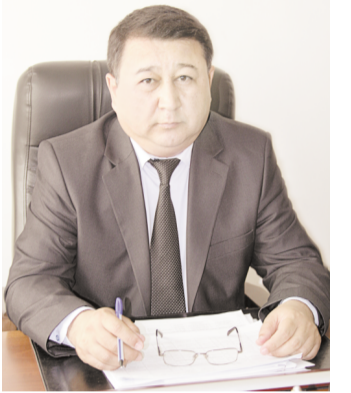
ахвол ўзгарди. Энди мақсадли сарф-харажатларга "йўл" берк. Бюджет маблағлари белгиланган мақсадларга ва тежамли сарфланмоқда.

– Фазна ижросига ўтиш ўзини оқлади. Соғлиқни сақлаш, халқ таълими ва ўрта махсус касб-хунар таълими муассасаларида амалга оширилган ислохотлар бюджет маблағларидан мақсадли ва самарали фойдаланишни таъминламоқда. Илгари бюджет муассасалари белгиланган меъёрларга риоя қилмай, ноўрин сарф-харажатларга йўл қўярди. Ҳатто, бюджет маблағларини ўзлаштириш ва бошқа суиистеъмолликларни содир этиш учун "дарчалар" мавжуд эди, десак янглишмаймиз. Фазна ижроси тизимига ўтиш билан