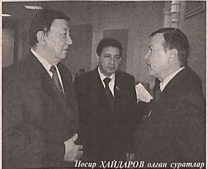
Посир ХАЙДАРОВ олган суратлар

Ижтимоий ҳимоя, энг аввало, олий мавжудот — инсон манфаатларига қаратилган бўлиб, у жамият аъзоларини эзгу мақсад атрофида жипслаштиради. Қолаверса, ижтимоий ҳимоя инсонларнинг белгиси ўлароқ, халқимизнинг миллий қадриятлари сирасига кирди. Минг йиллик тарихимизда бу тушунча ижтимоий адолат мезони сифатида қарор келинган. Шундай экан, қонунлари устувор юрда, инсонларар жамиятда бой ҳам, камбағал ҳам, қари-ю ёш ҳам тенг ҳуқуқли. Инсонларарлик, ижтимоий ҳимоя тушунчаларининг асл мазмун-моҳияти ҳам ана шу. Ўзбекистонда ҳам муқтақиллик йилларида аҳолини ҳар томонлама ижтимоий ҳимоя қилишга қаратилган ислохотлар бошқичма-бошқич ҳаётимизга жорий қилинапти.