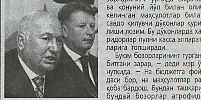
Шаҳар мэри Юрий Лукковнинг фикрича, буюм бозорларининг ўрнида сифатли ва қўний йўл билан олиб келинган махсулотлар билан савдо қилувчи дўконлар қуриши лозим. Бу дўконларда харидорлар пулни касса аппаратларига топширади.

Москва шаҳар ҳокимияти шаҳар ҳудудидаги барча буюм бозорларини ёпиши режалаштирмоқда.