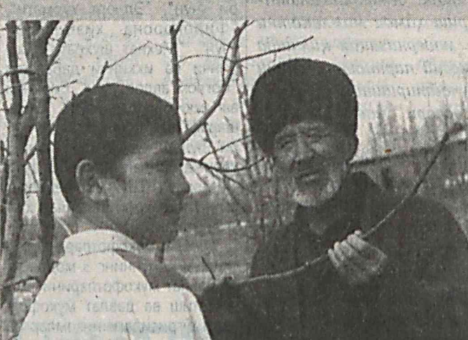
Тайлоқ туманидаги 1200 дан ортиқ фермер хўжалиги, 2 та йирик корхона, қимёсериш ва бошқа хизмат кўрсатувчи ташкилотларни бirlаштирган «Тезкор — барак» — файз» агрофирмаси ишчи бозор талаблари асосида ташкил этиб, юқори рентабелликка эришмоқда. Натижада деҳқонларнинг моддий манфаатдорлиги ортиб, истеъмол бозорини сифати маҳсулотлар билан тўлдириб имкониятлари кенгаймоқда.