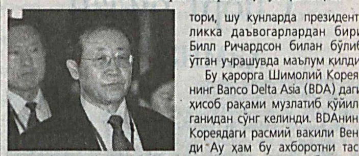
Бу ҳақда мамлакат Ташқи ишлар вазири уринбосари Ким Ге Гван Американинг Нью-Мексико штати губернатори, шу кунларда президентликка даъвогарлардан бири Билл Ричардсон билан бўлиб ўтган учрашувда маълум қилди.

Корея халқ демократик республикаси (КХДР) 30 кун мобайнида ядровий қурилмани тўхтатиб қўйиб, МАГАТЭ назоратчиларини қабул қилмоқчи.