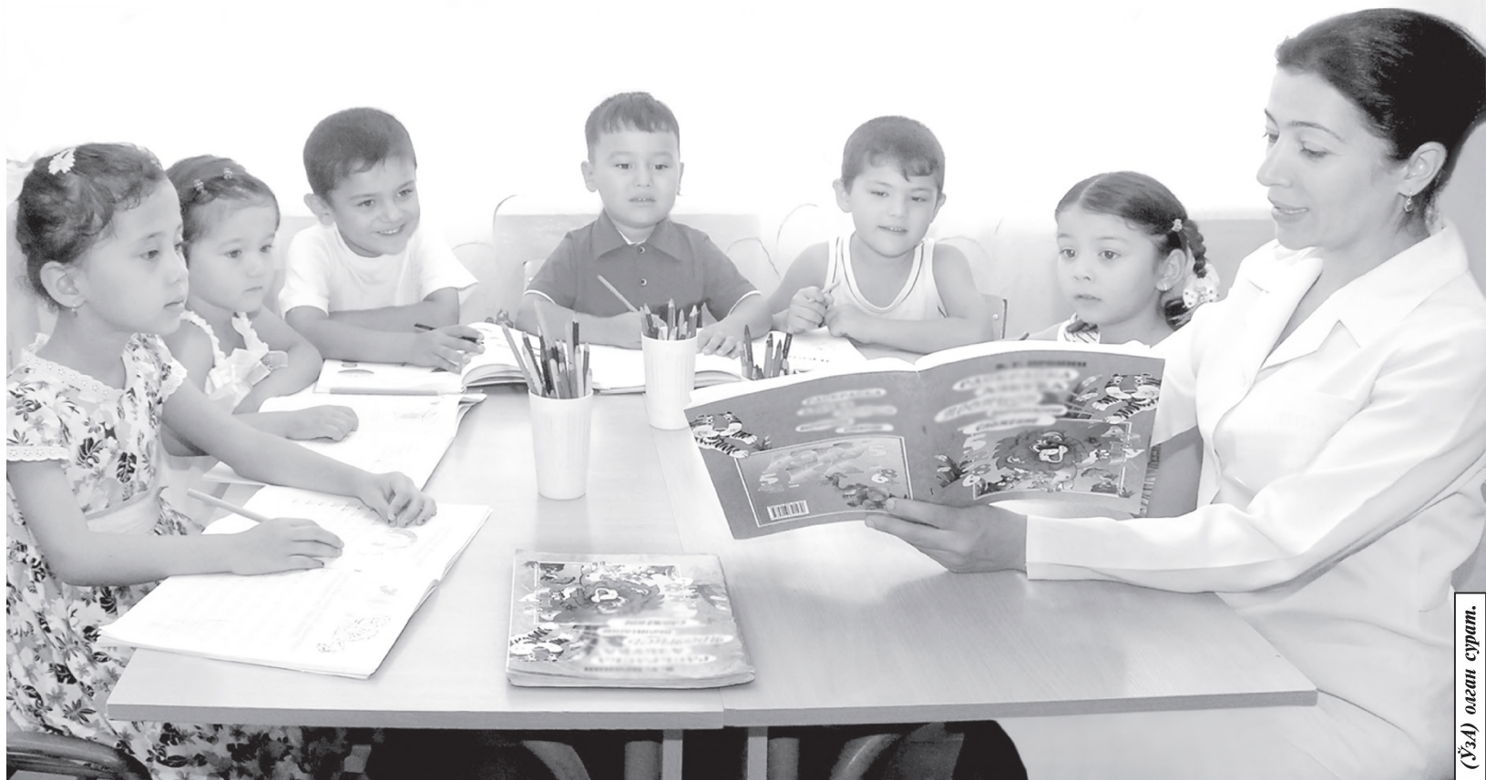
(Ў.А.) оқибат сурати.