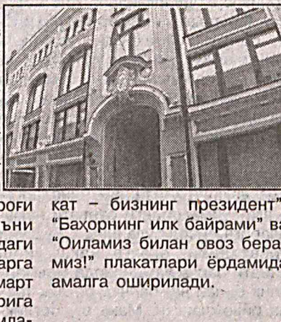
кат – бизнинг президент”, “Баҳорнинг илк байрами” ва “Оиламиз билан овоз берамиз!” плакатлари ёрдамида амалга оширилади.

11 январь кунини мамлакат Марказий сайлов комиссияси президентлик сайловларидаги таъшиқот даври учун тайёрланган реклама намуналарини ҳавола этди. Унга кўра, МСК томонидан ўтказиладиган ахборот кампаниясининг асосий эмблемаси Россия байроғи рангидидаги галочка, яъни римча V рақами шаклидаги белги бўлади. Тахминларга кўра, россияликларни 2 март кунини сайлов участкаларига “чақириш” “Бизнинг мамла-