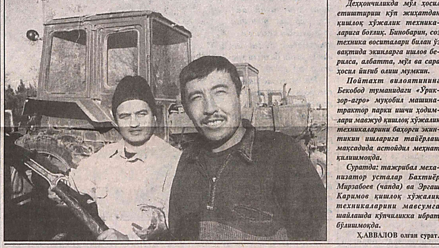
Деҳқончиликда мўл ҳосил этиштириш кўп жиҳатдан қишлоқ хўжалик техникаларига боғлиқ. Бинобарин, сохта техника воситалари билан ўз вақтида эквиларга ишлов берилса, албатта, мўл ва сара ҳосил йиғиб олиш мумкин.

қўшилди. Ушбу техника воситаларини сотиб олишда деҳқонларга банк муассасалари яқиндан кўмаклашмоқда. Навоий вилоят марказий банк бошқармасидан олинган маълумотга кўра, Хатирчи, Навбахор, Кармана ва бошқа туманларда фаолият кўрсатаётган фермер хўжалиқларига ушбу мақсад учун икки миллиард сўм миқдорда кредит ажратилди.