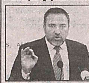
норози эканликларини билдиришган. Бу, энг аввало, асосий аҳолиси мусулмонлар бўлган Исроил ҳудудларининг Фаластин ҳудудларига назорати остига ўтиши эҳтимоли билан боғлиқ. Либерманнинг фикрича, 1967 йилдаги урушдан аввалги чегараларга қайтиш терроризмнинг тугатилишига олиб келмайди. Шунингдек, Либерман ўз партияси мустақил Фаластин давлати барпо этилишига қарши эмаслигини билдирган: “Биз икки халқ учун ҳар иккала мамлакат гоъяларини қўллаб-қувватлаймиз. Аммо биз ярим ҳукумат битта халққа ва ярим бошқасига каби моделларга қаршимиз”.

Ольмерт ҳукуматдаги коалиция иттифоқидан айриди.