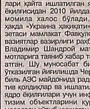
Чернобиль АЭС бўлинмалари қайта ишлатилган ядро ёқилгисидан 2010 йилда тамомила халос бўлади. Бу ҳақда “Украина ҳақиқати” газетаси мамлакат Фавкулотда вазирлар вазирлиги раҳбари Владимир Шандрой маълумотларига таяниб хабар тарқатган. Шу муносабат билан ўтказилган йиғилишида Чернобиль АЭС майдонида радиактив қолдиқлар ва ишлатилган ядро ёқилгилари учун инфратизим объектларини қуриш масаласи кўриб чиқилган.

Чернобиль ядро ёқилгисидан бутунлай қутулади, фақат икки йилдан сўнг.