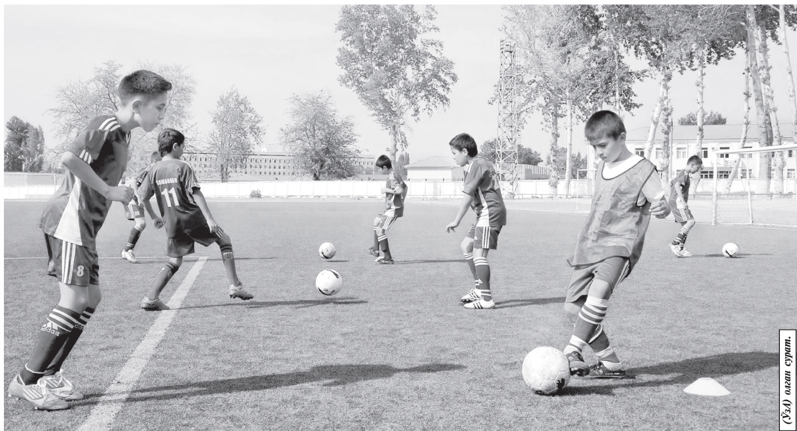
(ЎЗА) оғани суради.