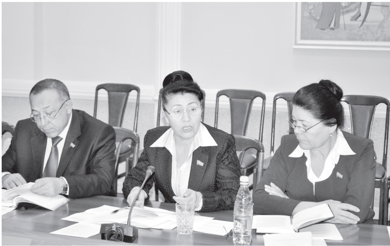
ЎзМТДП фракцияси аъзолари қонун лойиҳаларини муҳокама қилишмоқда.