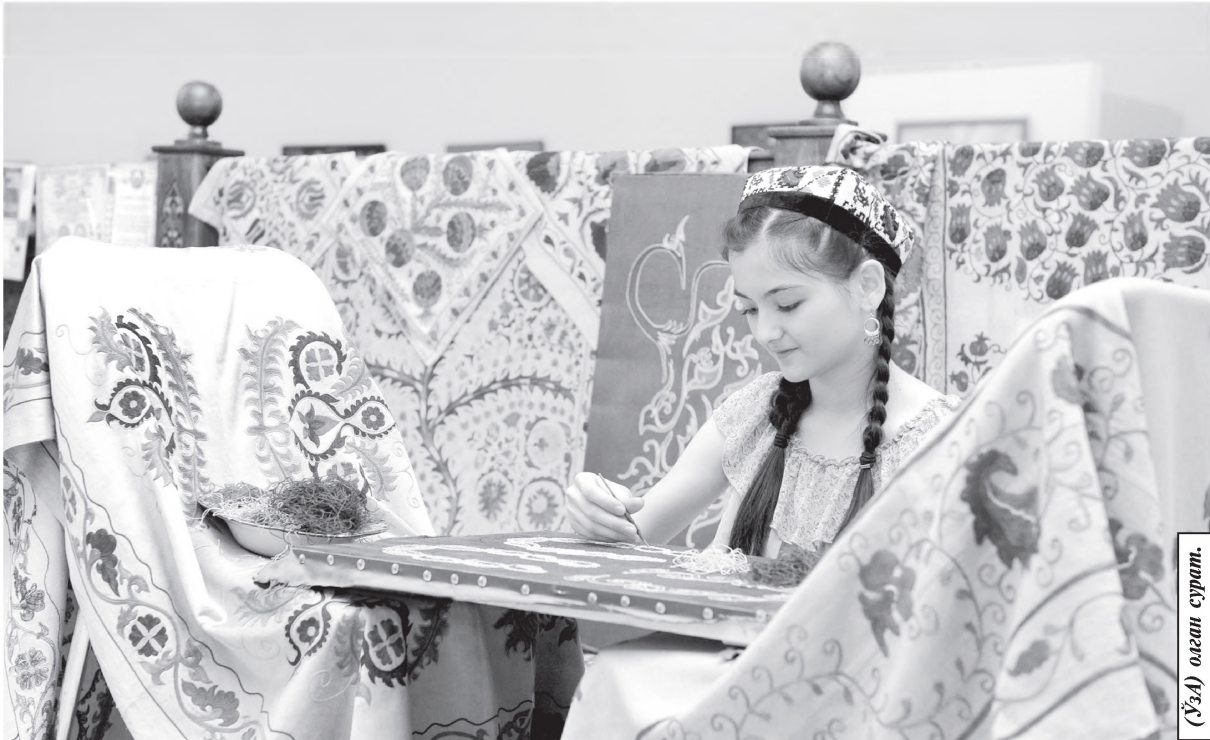
Ў.Ҳ.Ҳ. олеан сурат.