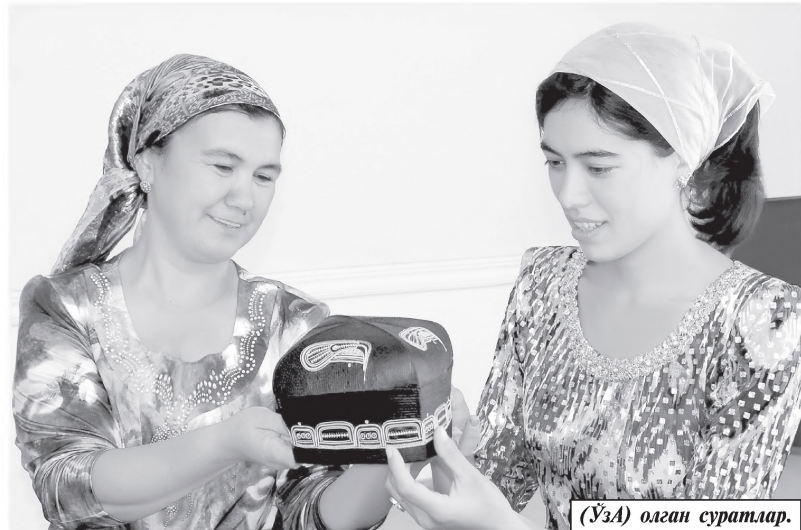
(Ў.А. олаги суратлар.)