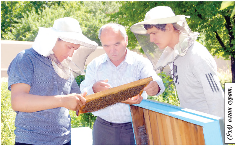
(ЎЗА) олим сўзлади.

Асал — она табиат томонидан инсонга инъом этилган бебаҳо неъмат. Бу хушбўй, шифобахш ширинликни етиштириб берувчи асаларилар меҳнатқашлиги ва ўзаро ишончилиги билан кишини ҳайратга солади. Улар ҳаво орқали тебраниши ҳис этиб, ҳудудан тез таъсирланишади. Инсон нафасини сезгудек бўлиши, дарҳол безовожланишади. Асалариларнинг кўрши қобилияти ҳам яхши ривожланган. Гулдан-гулга кўниб, биз бир ўтиришда наққос туширибдиган бир пийлагина асални минг бир машаққат билан тўпловчи бу заҳматқаш ҳашоратлар ҳақида ҳар қанча санирсак оз. Уларнинг ўзига хос ҳаёти кўпчиликни қизиқтириши табиий.