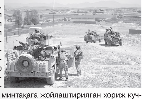
Интернет хабарлари асосида тайёрланди

Мазкур воқеани НАТО расмийлари тасдиқлаган, бироқ унинг тафсилоти ёқи ҳалок бўлган аскар қайси мамлакат фуқароси экани ҳақида маълумот тарқатмаган. Афғонистон расмийларига кўра, НАТО аскарига ҳужум террорчилар томонидан мамлакат шарқидagi Пактика вилоятида уюштирилган. Мазкур минтақага жойлаштирилган хориж кучларининг асосий қисмини АҚШ аскарлари ташкил этади. Ҳозир Афғонистонда 87 минг фарбик ҳарбий бор. Шундан 52 минг нафари америкалик аскарлардан иборат.