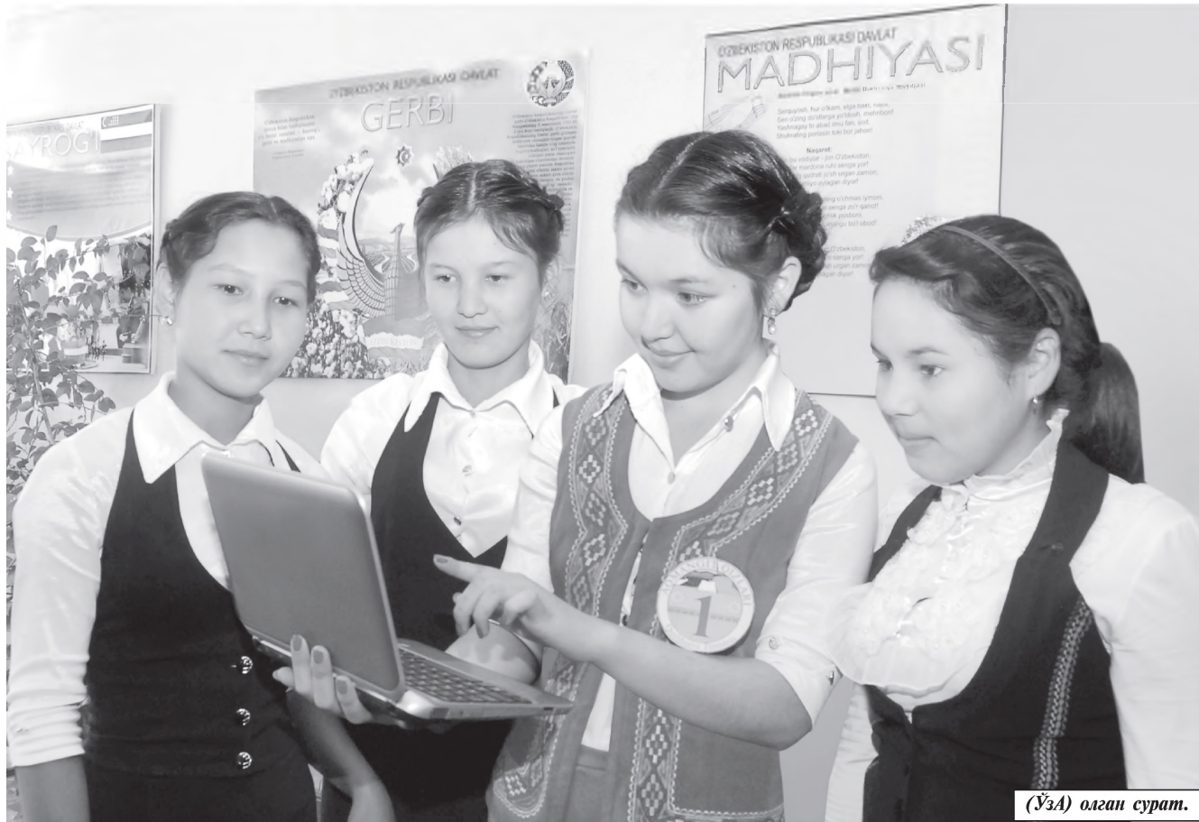
(У.А.) олаги сурат.