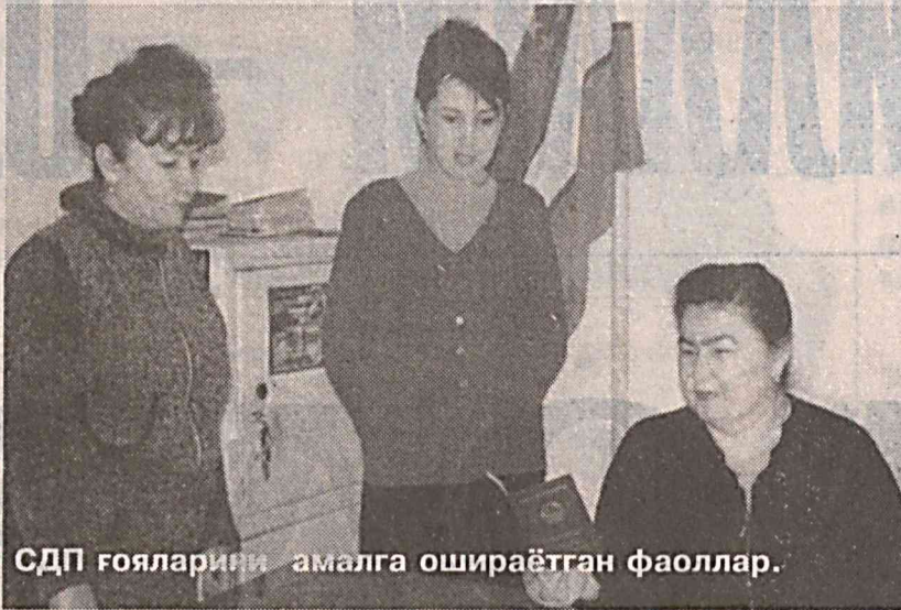
СДП ғояларини амалга ошираётган фаоллар.