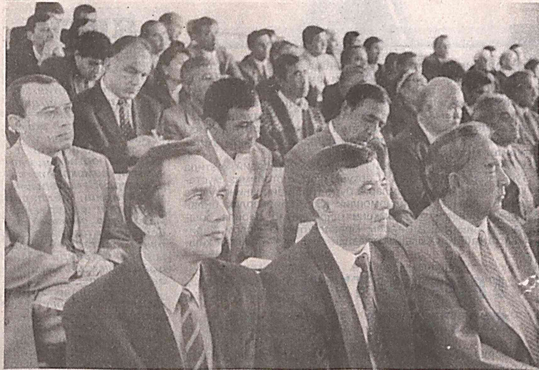
Суратларда: партиядошларимизнинг бугунги фаолиятдан лавҳалар