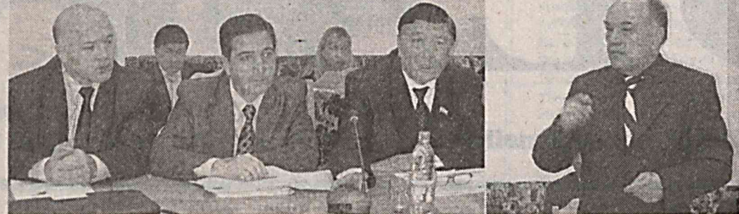
Муини кенг шакллантириш, ижтимоий-маиший хизмат, савдо шабоҳчаларини янада кенгайтириш, кичик бизнес учун янада қўлай шарт-шароитлар яратишга алоҳида эътибор берилади. Буларнинг барчаси кишлоқларда иш жойлари салмоғини оширишга омил бўлади.