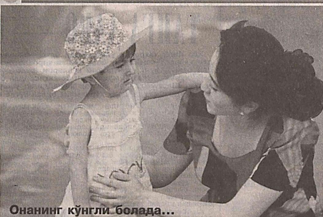
Онанинг кўнгли болада...