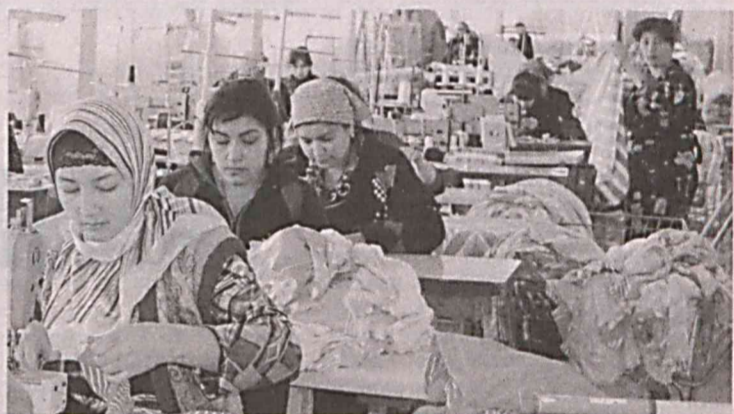
Бугун мамлакатимизда олиб борилаётган кенг қамровли иқтисодий ислохотларнинг самараси ўлароқ, жойларда сифатли ва бежирим тайёр маҳсулот ишлаб чиқарадиган корхоналар сонини кўпайтириш бормоқда.