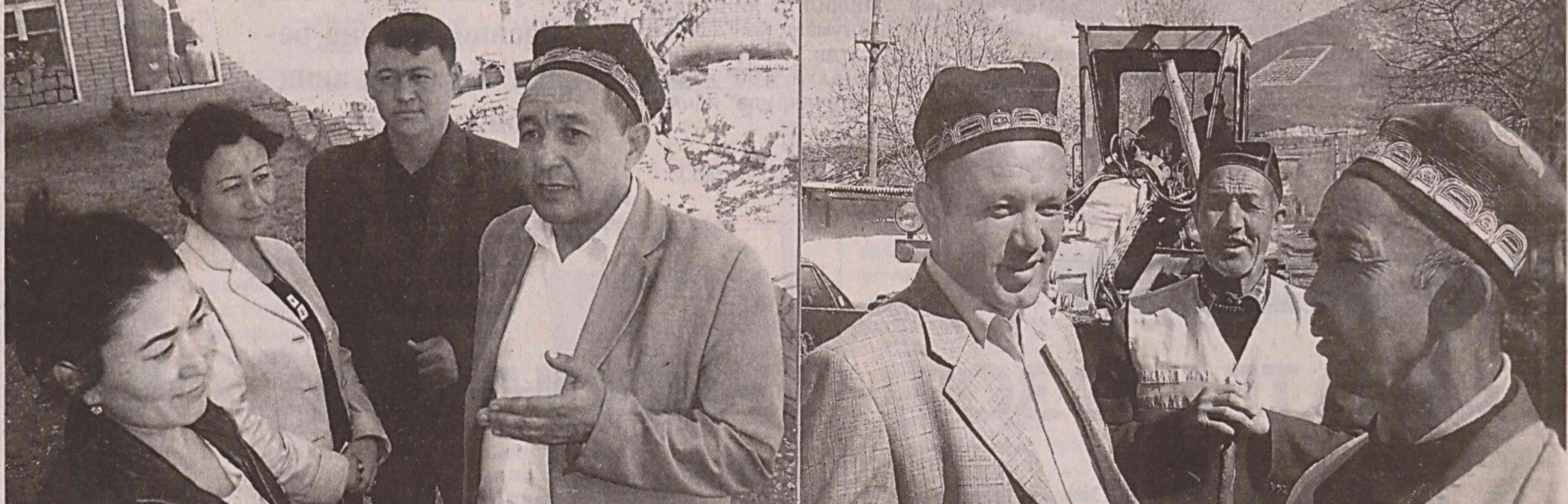
(Давоми. Бошланғичи 1-бетда.)

Таъмирлаш сифати алоҳида назоратга олинган. Чунки бу йил чекка тоғ қишлоғини шахар маркази билан боғлаб турадиган ягона иншоот. Дарвоқе, «Уртагузар» маҳалла бошланғич партия ташкилотининг 20 нафар аъзоси бурчга ана шундай масъулият билан ёндашадиган ҳозиржавоб, куюнчак кишилар. Улар оддий ўқувчи, фермер, тадбиркор. Мамлакатимиздаги янгиланиш жараёнларининг моҳиятини чуқур тушуниб етган ва бу жараёнларда ўзини сафарбар деб ҳис эта олган партиядошларимиз.