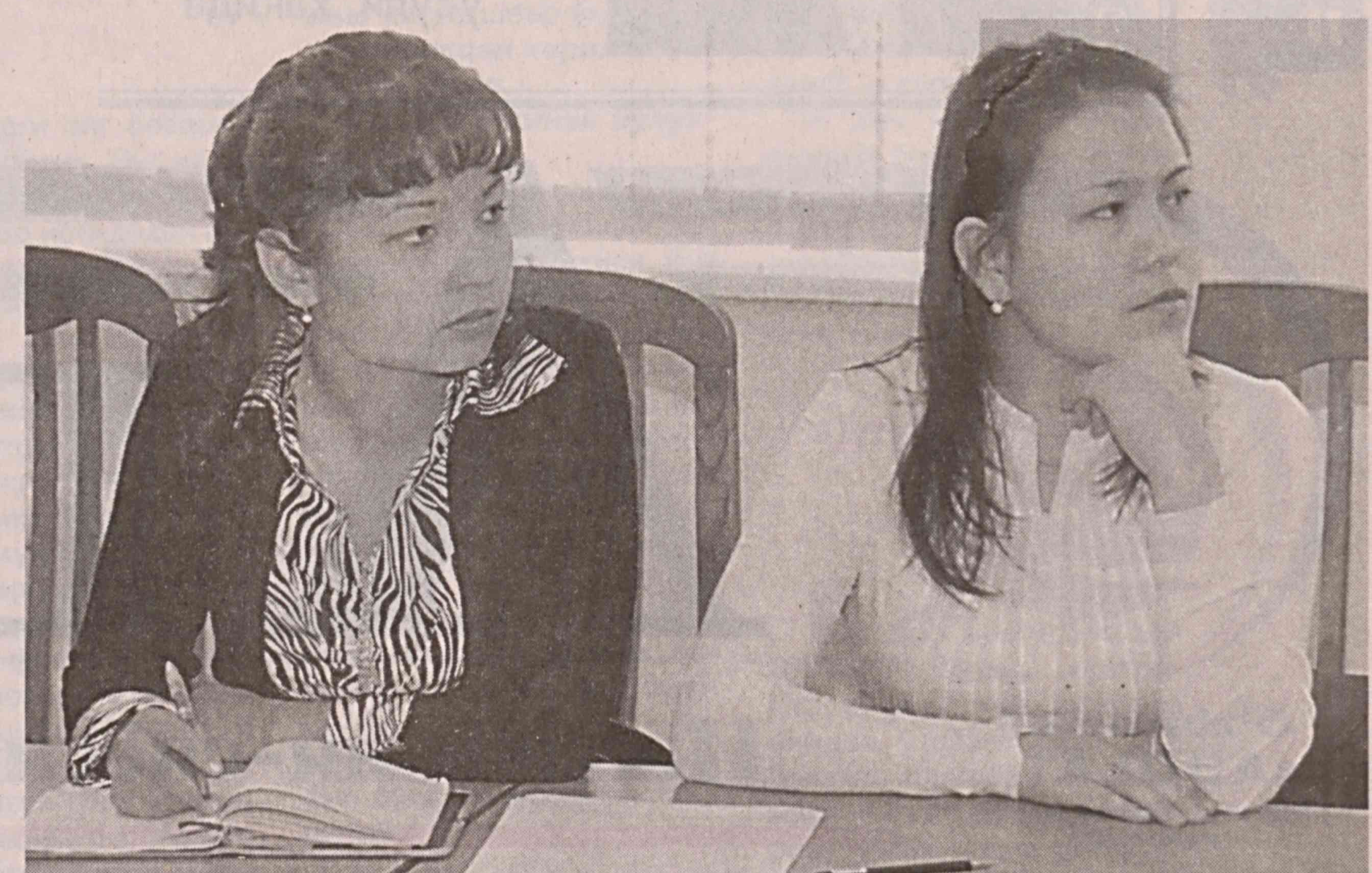
Жамиятимизда аёлларимиз нафақат она, турмуш ўртоғига сеvimли рафиқа, балки ўз куч салоҳияти ила мамлакатимиз тараққиқтига муносиб ҳисса қўшаётган фидойи зотлардир. Шу боис мустақилликка эришган кунларимизда ноқ аёлларимиз фаоллигига алоҳида эътибор қаратилди.