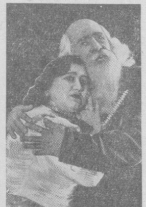
Наманганский областной музыкально-драматический театр поставил трагедию...

Осенью этого года на афришних тумбах, на стенах домов Конанда запестрели листовки. В них сообщалось о создании народного театра. Приглашались любители драматического искусства из самодельных коллективов.