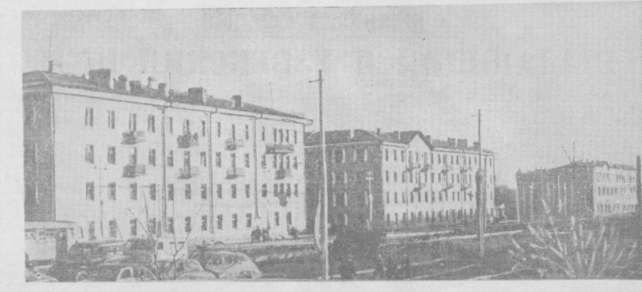
В Ташкенте с каждым годом растёт и благоустраивается район застройки завода. НА СНИМКЕ: новые жилые дома.