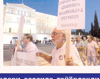
ЎзА ва интернет хабарлари асосида тайёрланди.

Хабарларга қараганда, сўнгги беш йил ичида мамлакатда ишсизлик уч барбар ўсди. Бу ҳолат, айниқса, ёшлар орасида авж олмақда. Мамлакатдаги кўплаб фирма ва компаниялар, молия-