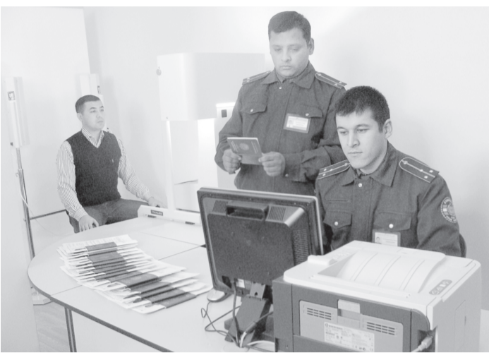
Биометрик маълумотларни олиш ва паспорт билан бошқичма-бошқич таъминлаётти.

Давлатимиз раҳбарининг Ўзбекистон Республикасида паспорт тизимини янада такомиллаштириш чора-тадбирлари тўғрисидаги Фармонида кўра, мамлакатимизда янги, эгаларнинг биометрик маълумотлари бўлган фуқароларнинг паспорт жорий этилди. Маҳаллий ҳокимият ва ўзини-ўзи бошқариш идоралари, қорхона ва ташкилотлар ҳамда ички ишлар органлари биометрик паспортларни марказлашган ҳолда тайёрлаш ва ҳисобини юритиш, фуқароларни паспорт билан бошқичма-бошқич таъминлаётти.