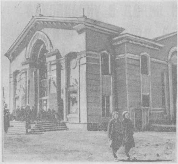
Кинотеатр «Узбекистан» в Намангане.