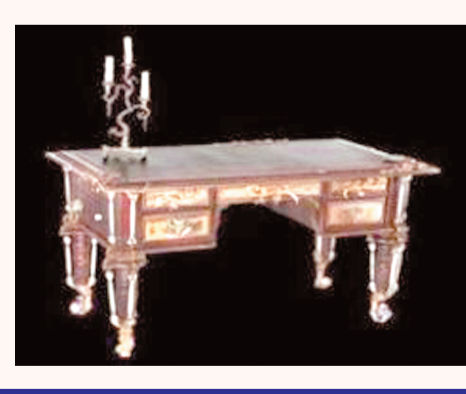
Ўза ва интернет хабарлари асосида тайёрланди.

Дунёга машҳур "Дракула" асарининг муаллифи - ирландиялик Брэм Стокернинг иш столи кимошди савдосига қўйилди. Кимошди савдоси жорий йилнинг 15-16 декабрь кунлари АҚШнинг "Profiles in History" савдо компанияси сайтида ўтказилди.