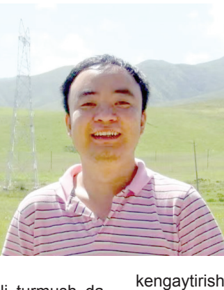
O'zbekiston xalqini donishmand Prezidentning oqilona rahbarligi ostida kun sayin yangi islohotlar asosida rivojlanib borayotganini chuqur his etmoqdaman.

Bizning "XI'AN PUS GROUP" kompaniyasi jamoasi, shu-niingdek, "Bir makon, bir yo'l" tashabbusi doirasida Samarqand viloyatida yangi energetika, qish-loq xo'jaligi, infratuzilma, biotib-biyot, sog'liqni saqlash sohalariga investitsiyalarni faol ravishda jalb qilib, O'zbekistonning Guanch-jou Bosh konsulkonasi bilan birga o'z faoliyatimiz doiralari-ni kengaytirishda davom etmoqdamiz.