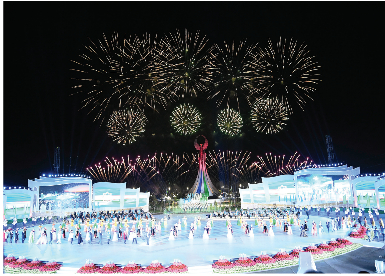
Xoson ПАЙДОЕВ ошон суьратлап.