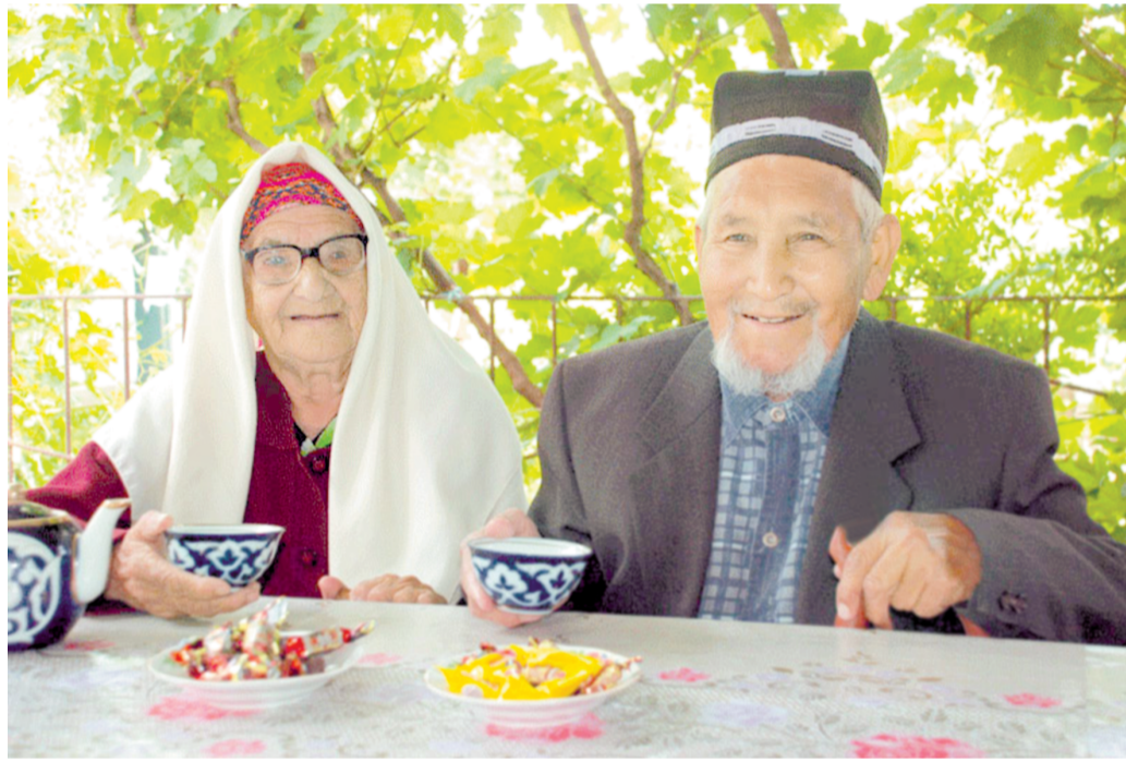
Осмони мусаффо юртимизнинг мамнун нурунийлари.