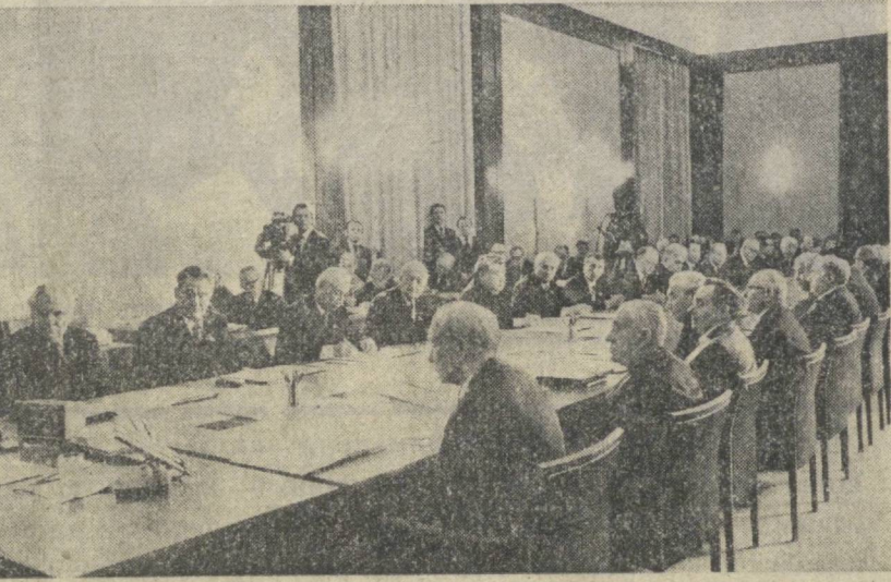
Заседание Президиума Верховного Совета СССР. Товарищ Л. И. Брежнев подписывает Указ о ратификации Договора и ратификационную грамоту.

Особенно перспективным считают специалисты, является Сарыкамышское озеро, водная гладь которого достигает 220 тысяч гектаров. Здесь можно разводить усачей, сазанов, жерлиц, лещей и ежегодно отлавливать до 22 тысяч центнеров рыбы.