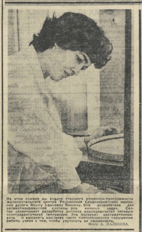
На этом снимке вы видите старшего инженера-программиста...