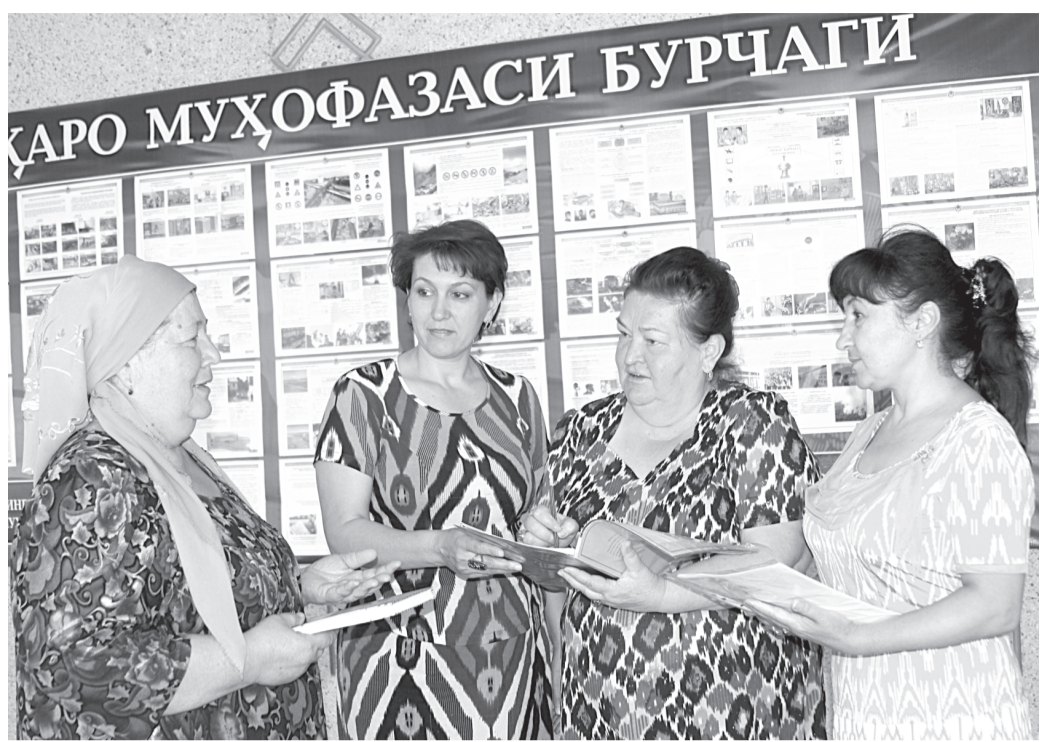
«Баркамол авлод – 2014»

Наманган шаҳрида ўрта махсус, касб-хунар таълими тизими ўқувчиларининг "Баркамол авлод – 2014" спорт мусобақалари ўз ниҳоясига етди. Мусобақада биринчи ўринни Тошкент шаҳри, иккинчи ўринни Наманган ҳамда учинчи ўринни Самарқанд вилояти жамоалари эгаллашди. Улар Президент совғаси – "Дамас" автомобиллари билан тақдирланишди. Шунингдек, мусобақаларда спортчи-ёшлар орасида юқори натижаларга эришган бир гуруҳ спортчи-ўқувчилар махсус совринларга сазовор бўлишди.