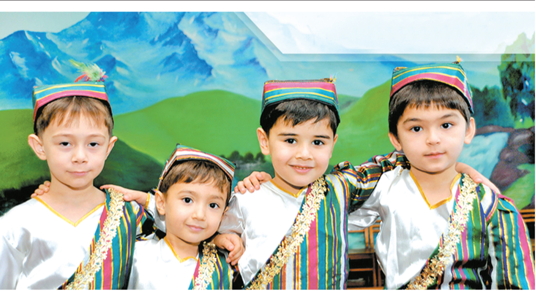
– Дўппи кийдик, йигит бўлдик.