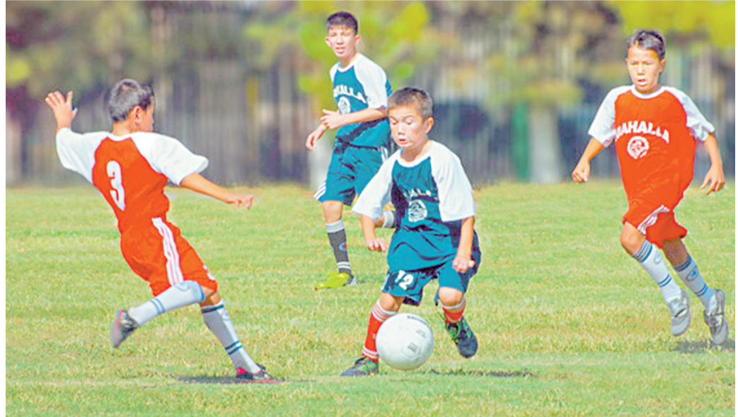
Гулистон шаҳрида анъанавий "Футболимиз келажаги" кубогининг минтақавий республика босқичи мусобақасининг "Г" гуруҳи ўйинлари бўлиб ўтди.

Пойтахт ҳамда Тошкент, Жиззах, Сирдарё вилоятларидан келган 9-10, 11-12 ёшдаги болалар ва 13-14 ёшдаги ўсмирлар жамоалари голиблик учун курашишди.