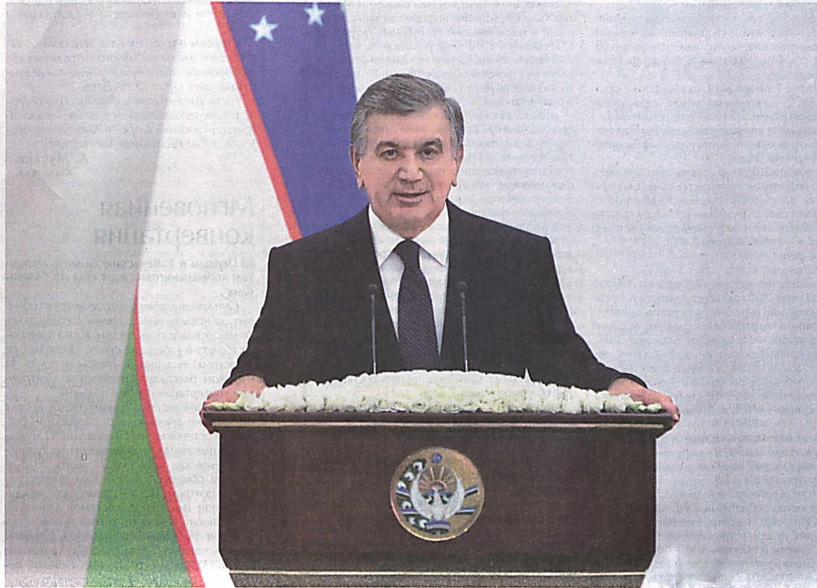
Президент Республики Узбекистан Шавкат Мирзиёев для ознакомления с осуществляемой на местах созидательной работой, крупными проектами, а также диалога с народом 12 июня прибыл в Ферганскую область.

В рамках инвестиционной программы по Ферганской области на 2018 год запланировано осуществить 285 проектов, из них к настоящему времени завершены 35. В области действует 212 совместных предприятий, за минувший период этого года зарегистрированы 45 предприятий с участием иностранного капитала.