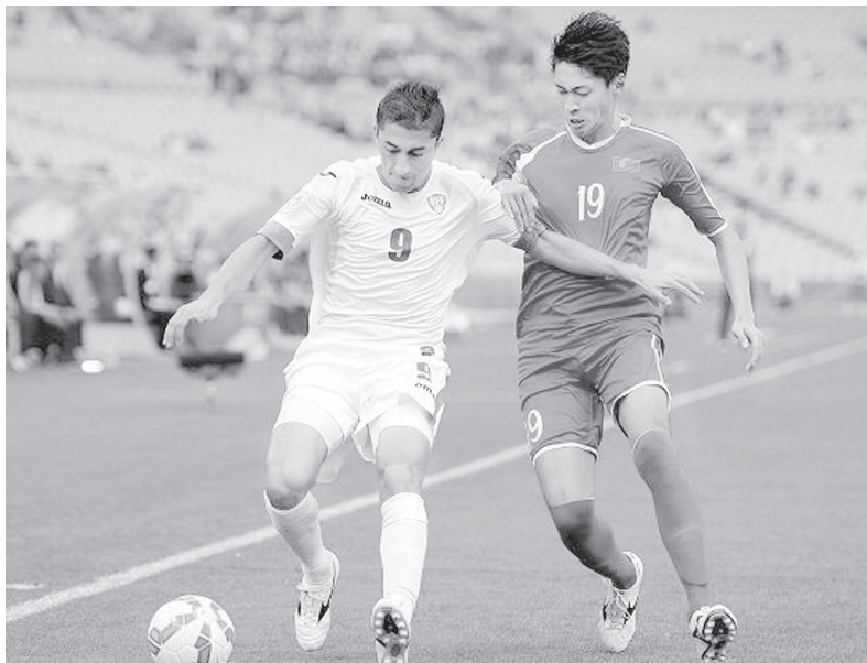
(Давоми, бошланиши 1-саҳифада)

Учрашувнинг 62-дақиқасида Игор Сергеев томонидан киритилган гол терма жамоамизга Осиё Кубогидаги дастлабки очкони келтирди.